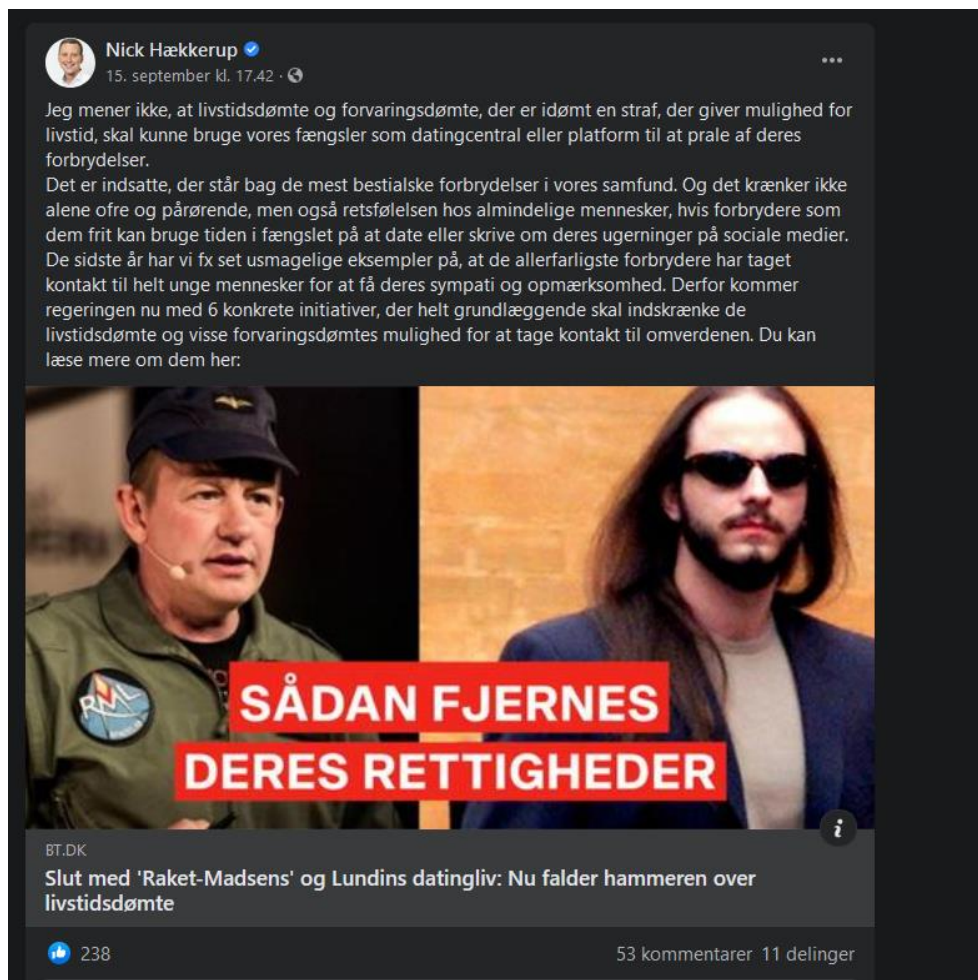
Screenshot fra Justitsminister Nick Hækkerups facebook-side